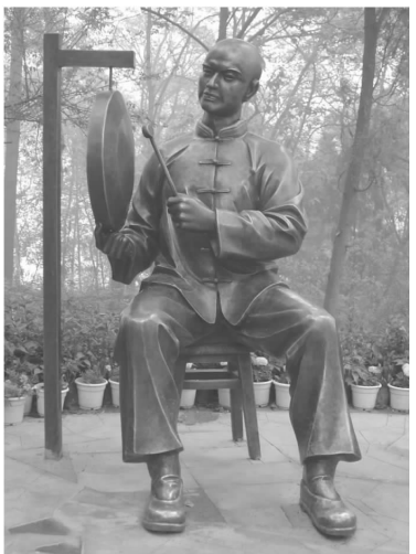
川剧小品系列4 锻铜 高150cm

朋友发来一张剧照，舞台上摆着一桌二椅，桌椅是果绿色的，绣着红、黄、二色鲜花，果绿色的绣花椅披。一桌二椅的后面，矗立着紫色镂花的四扇屏风，分别嵌着梅兰菊竹四幅图画。这桌二椅，看着倒也雅致。但看剧照中的人物，是一生一旦，武生是戴罗帽穿打衣的武松，花旦是穿红褶子、系花兜肚的潘金莲，剧目是《打饼》。却着实令人大吃一惊，这场景，是武大郎的家吗？