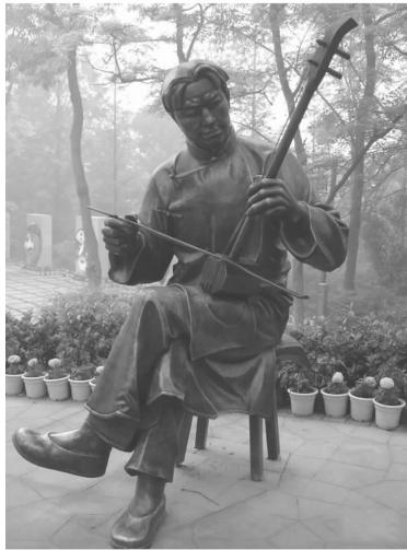
川剧小品系列1 锻铜 高150cm

范文，山西临汾人。毕业于四川美术学院雕塑系，现为四川雕塑艺术学院教授、雕塑家，中国工艺美术学会民间专业委员会副主任委员、《中国工艺美术全集·四川卷·雕塑篇》执行主编，中国雕塑学会会员。其代表作有《川剧小品》系列、《和平》《紫气东来—老子》《友谊》《鹰击长空》《孕》《盼》《更高、更快、更强》《前三苏》《激情岁月》《叱咤风云》《欢乐颂》《古蜀之源》等等，其作品多次参加国际雕塑邀请展，并获奖。