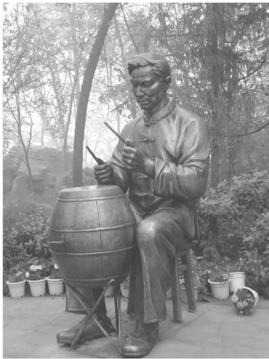
川剧小品系列2 锻铜 高150cm